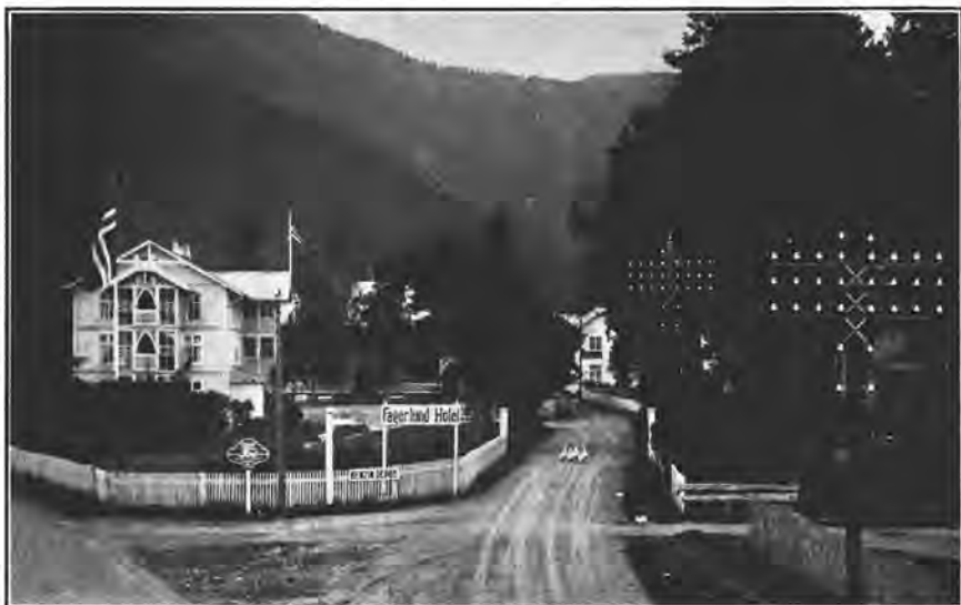
Fagerlund Hotel, Fagernes

Reisen op gjennom Vestre Slidre er kanskje endnu vakrere end længere nede. Hovedbygden er meget frugtbar med veldyrkede dalsider og grønne ller som speiler sig i fjorden. I Vang har naturen et strengere præg. Det blir efterhaanden mindre skog og mere nakne fjeld og tilslut gaar dalen over i høifjeldet.