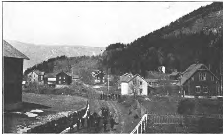
Leira i Nord-Aurdal

Fra Odnes gjennom Nordre Land og over Tonsaasen er vel egentlig hovedindgangen til selve Valdres. Den vei gaar jernbanen, og "Kongs-