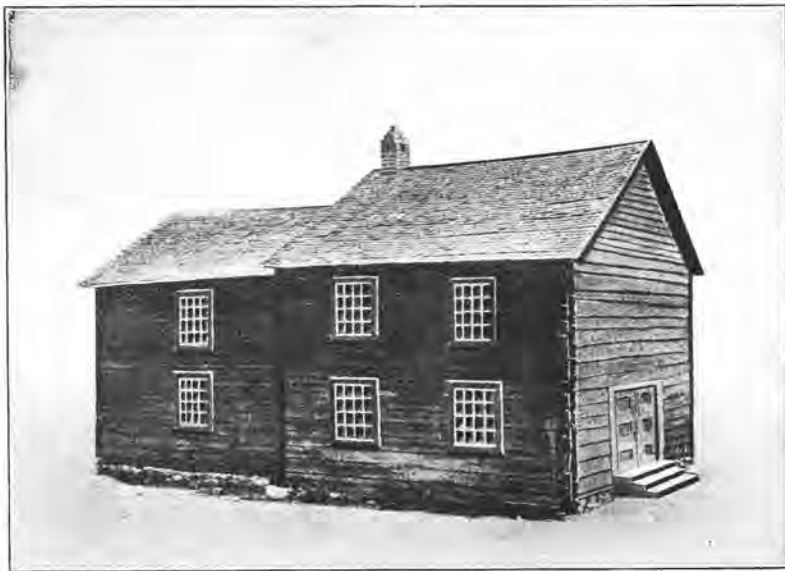
Den første norsk lutherske kirke i Amerika, opført i Muskego, Wis., 1844, og nu flyttet til Luther Teologiske Seminar i St. Paul, Minn.

Det var en gripende høitidsdag for alle tilstede av norsk herkomst, som har sin Gud, bibel og fædreland kjær. Da forsamlingen denne solrike sommerdag stod utenfor kirken, omringet av de norske