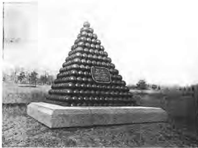
Monument reist paa slagmarken ved Chickamauga, hvor oberst Heg faldt

Regimentets historie er saa ærefuld for os norsk-amerikanere, at det virkelig skulde være noget av en opgave for ethvert bygdelag at forsøke saavidt mulig at faa navnene paa dem som var med. Ovenstaaende kan tjene som en begyndelse, og hvis alle som sitter inde med oplysninger om valdreser i det 15de Wis. eller som kan rette paa urigtige oplysninger i det ovenfor anførte burde gjøre dette og faa listen saa komplet og korrekt som mulig.